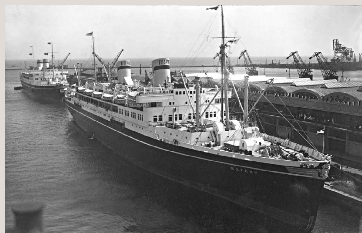
MS Piłsudski and MS Batory , 1930s