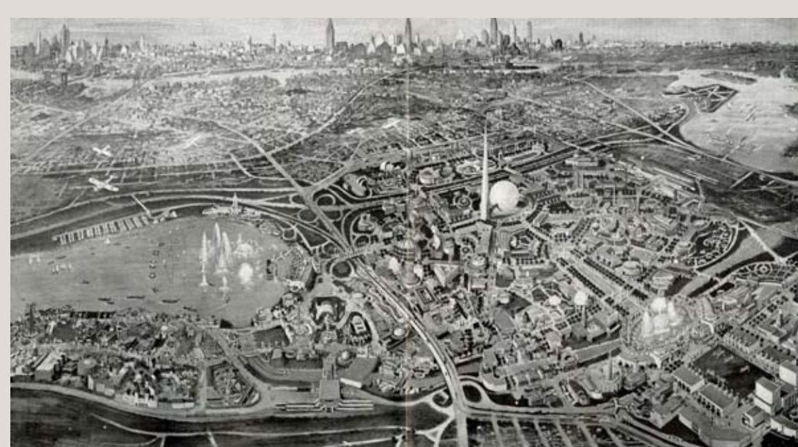
New York World's Fair 1939-1940